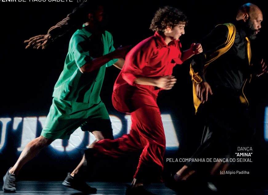
DANÇA "AMINA" PELA COMPANHIA DE DANÇA DO SEIXAL

29 E 30 ALHOS VEDROS ROCK FEST 2026 [P.9]